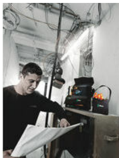
Wera 2go 4 Kapsa na nářadí