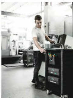
Wera 2go 4 Kapsa na nářadí