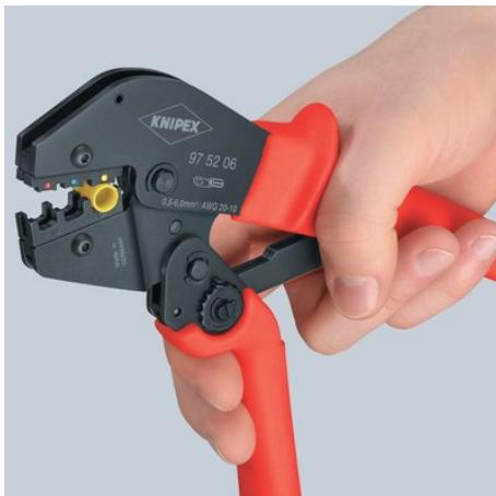
První krok: nadzdvížení ramena dvěma prsty, dokud obě čelisti neleží na lisované spojení