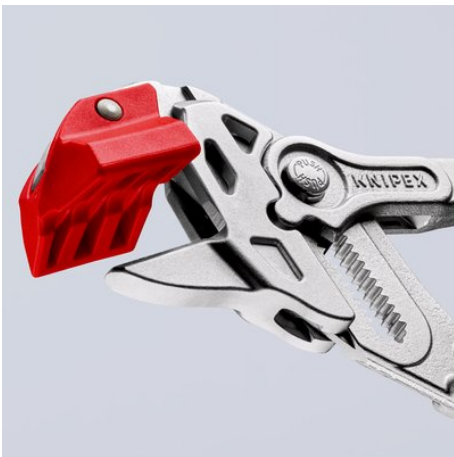
plastová dosedací čelist: otočná pro čistý lom a optimální ochranu dlaždice před poškozením