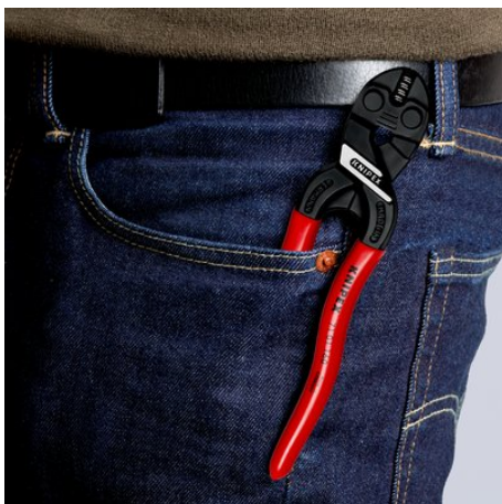
Kompaktní, lehké a vždy po ruce