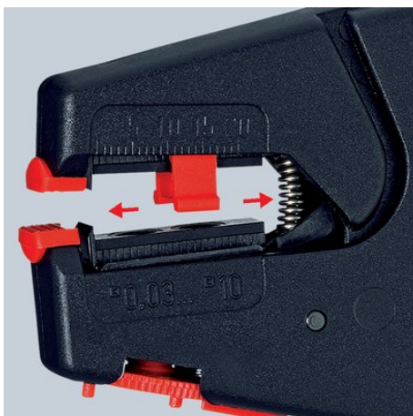
12 40 200: Nastavitelný délkový doraz