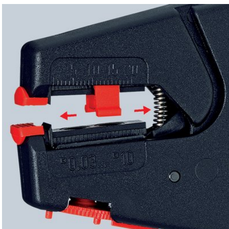
12 40 200: Nastavitelný délkový doraz