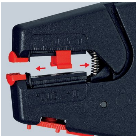
12 40 200: Nastavitelný délkový doraz