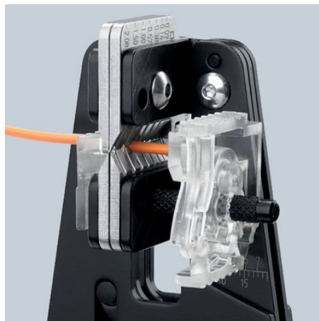
Tvarově se přizpůsobující odizolování díky precizním profilům nožů